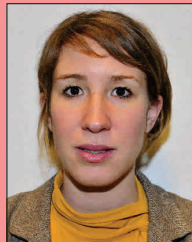
Mond niet gesloten