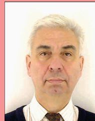
Onvoldoende contrast hoofd/achtergrond