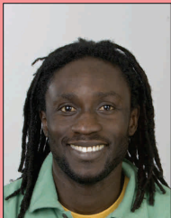
Mond open, tanden zichtbaar