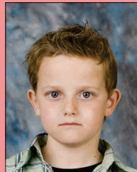
Achtergrond niet eenkleurig